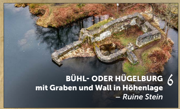
BÜHL- ODER HÜGELBURG 6 mit Graben und Wall in Höhenlage – Ruine Stein