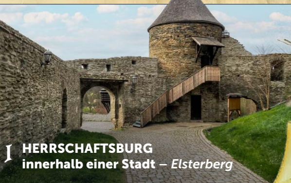
1 HERRSCHAFTSBURG innerhalb einer Stadt – Elsterberg