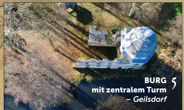
BURG 5 mit zentralem Turm – Geilsdorf