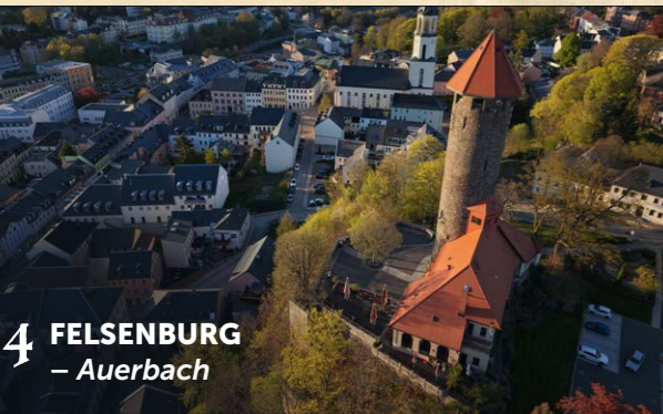
4 FELSENBURG – Auerbach