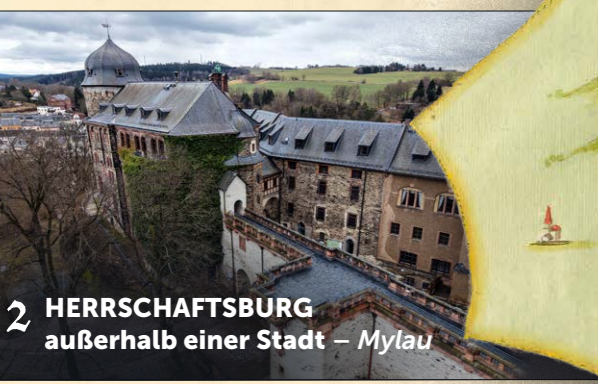
2 HERRSCHAFTSBURG außerhalb einer Stadt – Mylau