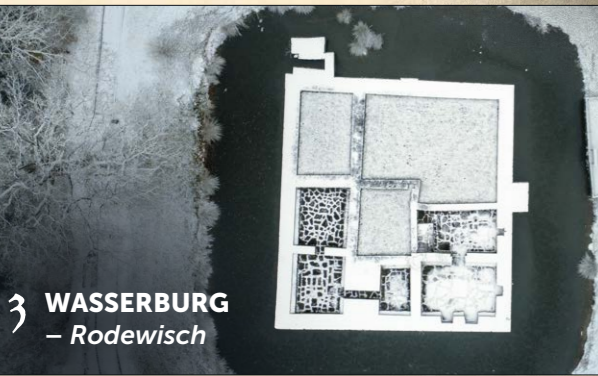
3 WASSERBURG – Rodewisch