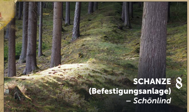
SCHANZE 8 (Befestigungsanlage) – Schönlind